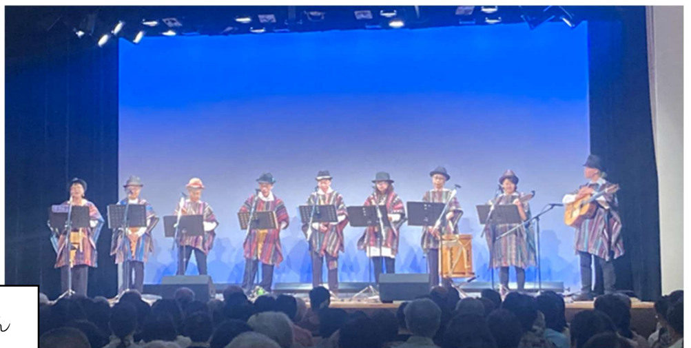
グルーポマルテスの皆さん